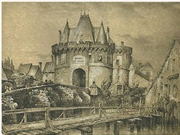
Le Livre d'histoire

La population qui s'était groupée autour de l'église dédiée à Saint-Martin et bâtie au pied du coteau où s'éleva le château de Vendôme, s'accrut sensiblement après la fondation du monastère de la Trinité. Elle forma alors un centre où les habitants qui n'appartenaient ni à la noblesse ni au clergé étaient pour la plupart engagés dans les liens d'une servitude se rapprochant de l'ancien esclavage romain dont elle était le prolongement, dépendant du comte ou de l'abbé qui exerçaient un pouvoir sans contrôle ni limite. La rigueur de ce système suscita à la longue des idées et des désirs d'émancipation qui amenèrent, avec le temps, l'établissement des communes. C'est probablement vers la fin du XIIe siècle que le besoin de résister à leurs oppresseurs poussa les Vendômois à se concerter pour défendre leurs personnes et leurs biens. Répondant au mouvement d'opinion favorable à une réforme de l'état social, les comtes de Vendôme accordèrent dès cette époque des droits de bourgeoisie à certains de leurs hommes, comme en témoignent les chartes de donation à des établissements religieux où figurent parmi les objets donnés, un