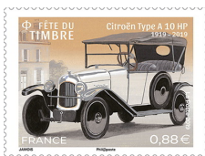
Timbre Citroën Type A 10 HP

Un bureau de poste temporaire avec oblitération spéciale leur permettra de se procurer le timbre et le bloc émis à cette occasion :